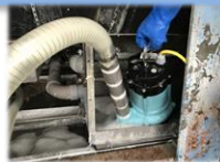
クリーニング工場